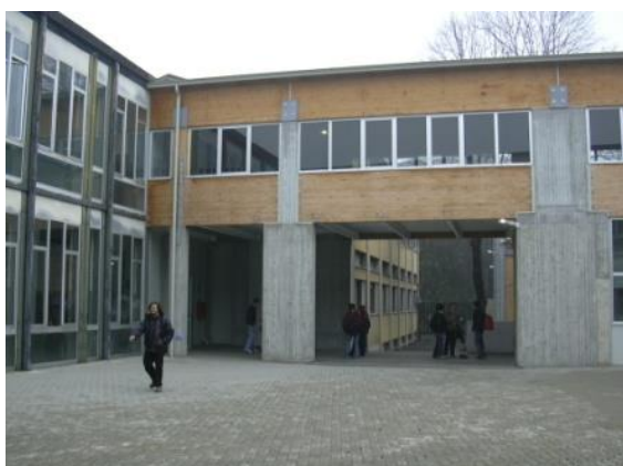
LICEO SCIENTIFICO E LICEO DELLE SCIENZE UMANE CORTILE INTERNO