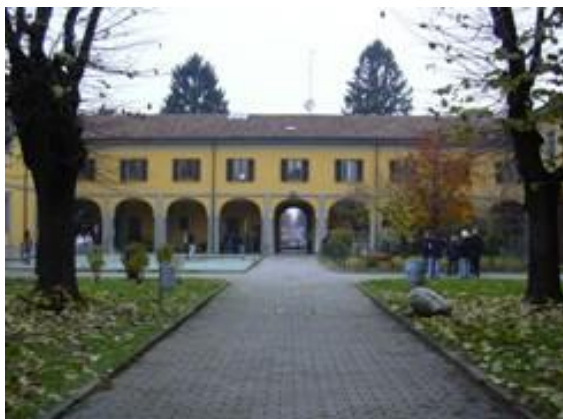
ISTITUTO TECNICO COMMERCIALE E LICEO DELLE SCIENZE UMANE CORTILE INTERNO